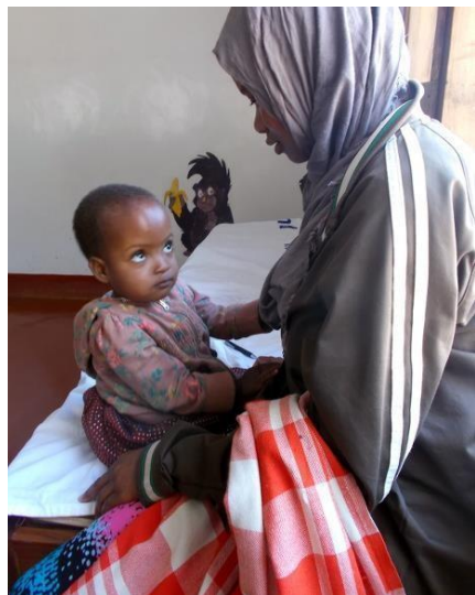
La maggior parte dei bambini ha un bell'aspetto

Ora vado ad Haydom per partecipare a un seminario sulla spina bifida e l'idrocefalia. Haydom è una piccola città nel centro della Tanzania che è stata costruita intorno a un ospedale con 400 posti letto.