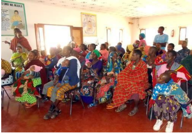
Più di 40 famiglie partecipano alla conferenza