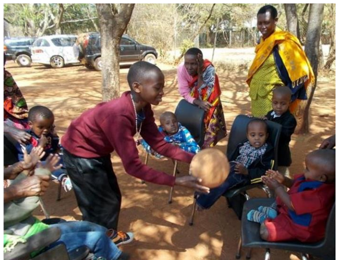
Durante gli esami e le discussioni, i bambini giocano