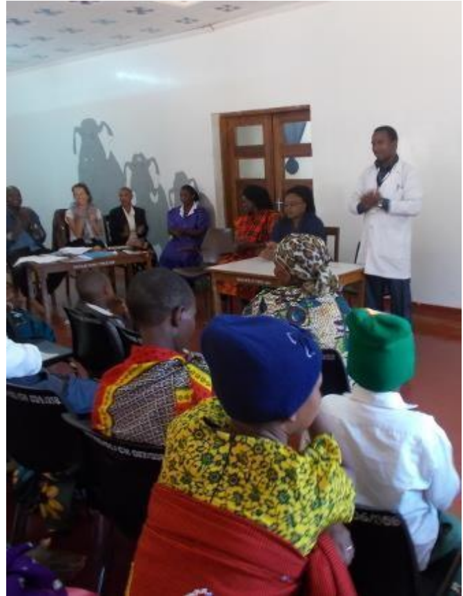
Il direttore di Haydom si rivolge al pubblico caldamente

Il pediatra sottolinea la necessità di misure preventive, visto che di recente sono arrivati molti nuovi pazienti. Rispondo che si sono presentati più bambini, visto che ora c'è un'assistenza disponibile a Haydom. Quando un gelato ha un buon sapore, è disponibile e conveniente e si ottengono sempre più clienti. Lo vediamo ovunque.