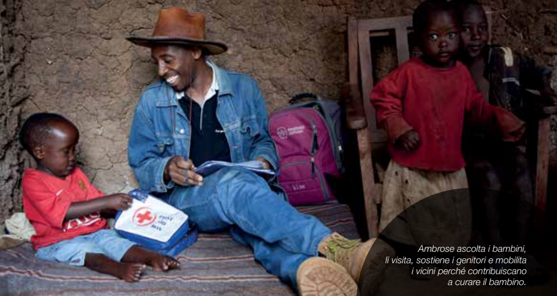
Ambrose ascolta i bambini, li visita, sostiene i genitori e mobilita i vicini perché contribuiscano a curare il bambino.

Fortunatamente sempre più genitori di bambini con spina bifida e idrocefalo si rivolgono ai nostri partner e operatori locali per le cure e il sostegno necessari . Possiamo così intervenire in tempo ed evitare emergenze e ulteriori aggravamenti della disabilità. Possiamo migliorare la qualità della vita dei loro figli!